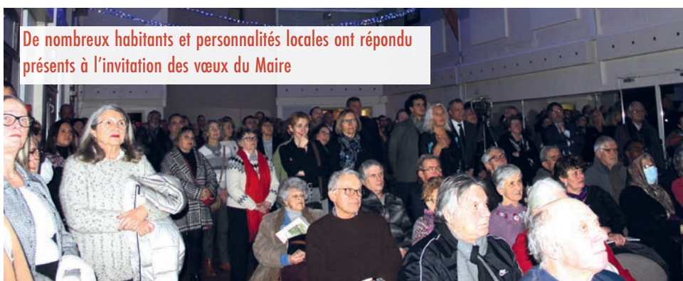
De nombreux habitants et personnalités locales ont répondu présents à l'invitation des vœux du Maire