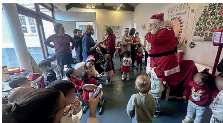
Dans la classe de petite et moyenne sections à l'école Blanche-de-Castille