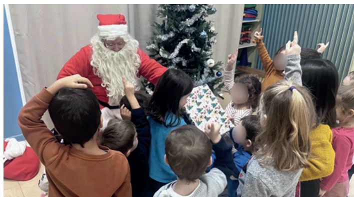
Le Père Noël à l'école du Bois Bonnet à Baillon