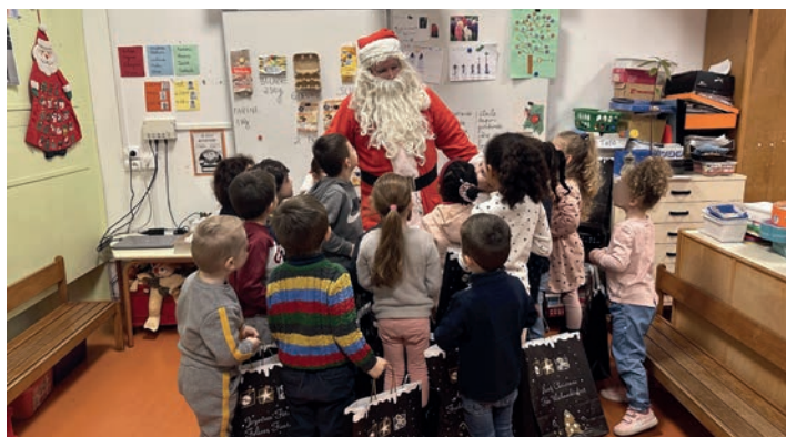
La chorale de Noël des enfants de l'école du Bois Bonnet le 15 décembre