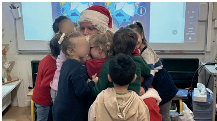
L'association Risettes et Galipettes fête Noël le 22 décembre