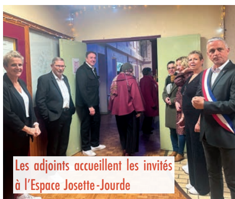
Les adjoints accueillent les invités à l'Espace Josette-Jourde