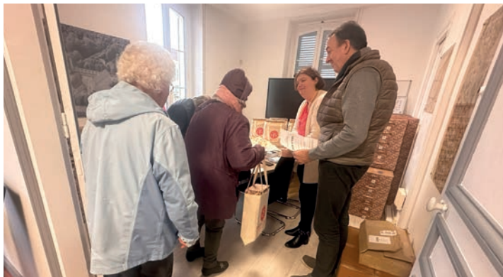
Grati'jouets par En Tête la planète ! le 10 décembre